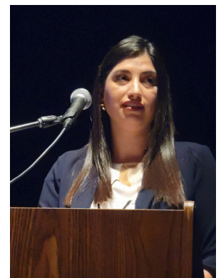
Personal de la NLBHA y APA Cumbre de la juventud, abril de 2026